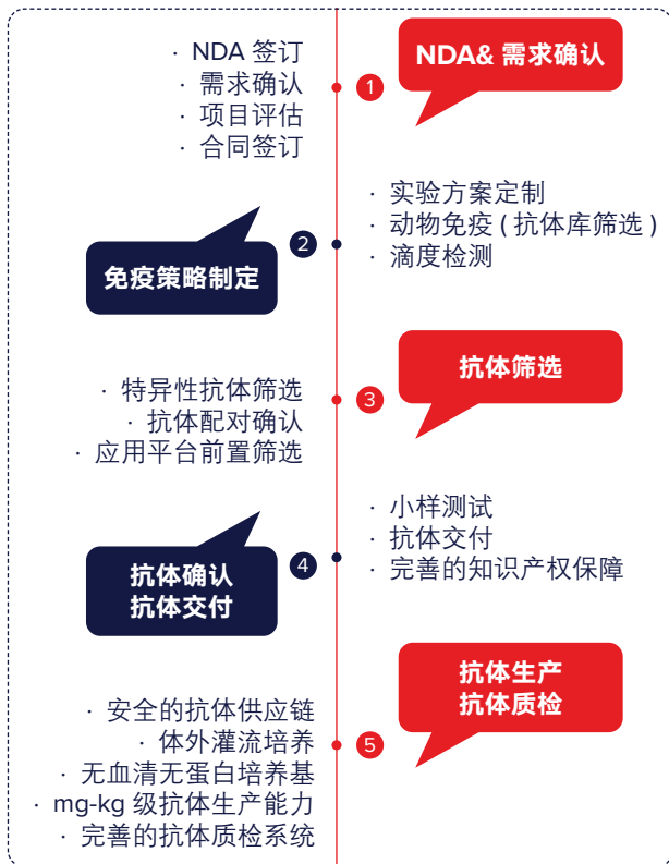
图 1. 抗体定制化开发服务流程